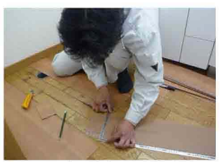
▲ トイレ床・壁紙 貼り変え