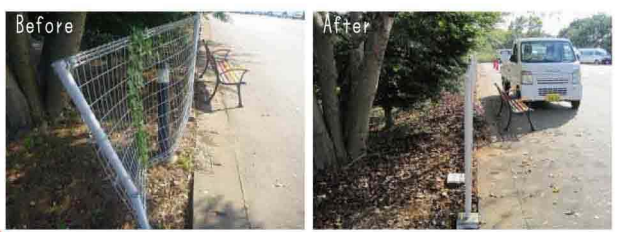
▲ フェンスの交換 ▲